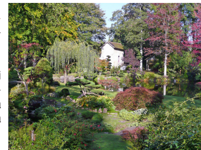
Jardin Japonais du château de Courances

2 Poursuivre tout droit et rejoindre le point de départ.